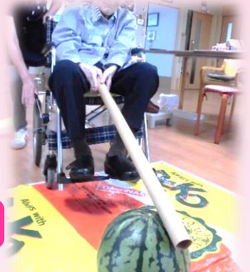
スイカ割りというカスイカたたき